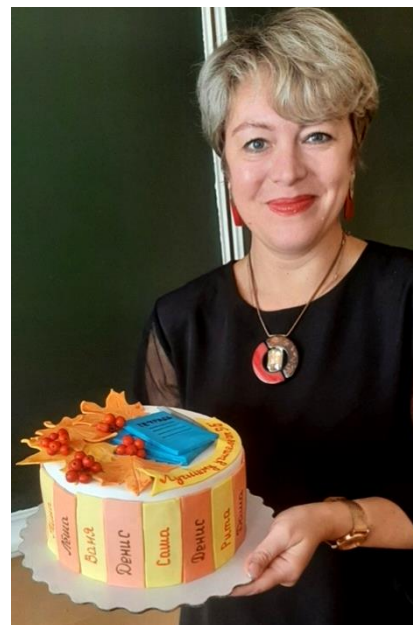
Команда «Левитановцы» МБОУ г. Владимира «СОШ № 43 им. Ю. Б. Левитана»