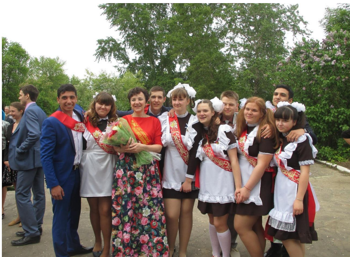
Команда «Эврика» МБОУ «Боголюбовская СОШ имени чемпионки мира по шахматам Е.И. Быковой» Суздальского района