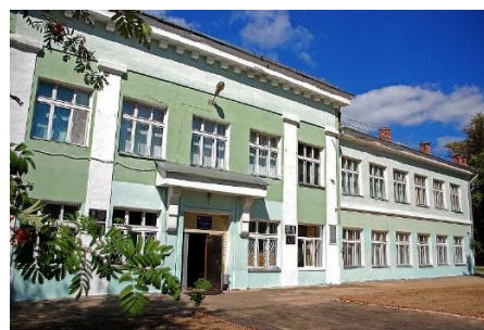
МБОУ СОШ номер 13

В 1933 году, получив квалификацию учителя начальной школы, она работает в селе Урваново, Ляховского района Горьковской области. В 1934 году она получает назначение на работу 1-ую начальную школу, а в 1935 году вместе со своим классом переходит в 13-ую среднюю школу имени Горького.